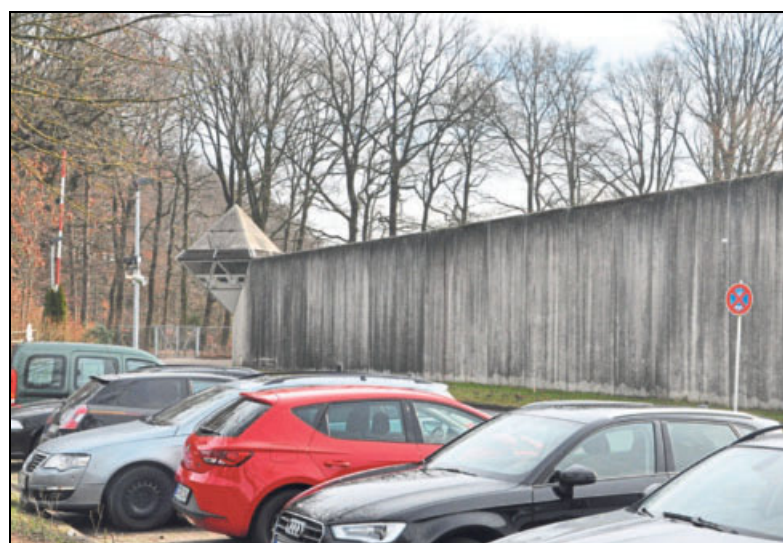
Blick über die nördliche Gefängnismauer auf den alten Baumbestand neben der Ostmauer: Diese Buchen und Eichen müssten der geplanten JVA-Erweiterung geopfert werden.